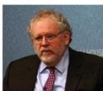
Walter Russell Mead

Китай, Иран и Россия так и не смирились с геополитическим порядком, сложившимся после холодной войны, и предпринимают все более активные попытки его разрушить. Процесс не будет мирным, и, независимо от того, преуспеют ли в этом ревизионисты, их действия уже подорвали баланс сил и изменили динамику международной политики