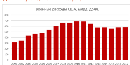
Динамика расходов США на оборону

За океаном их интересы во многом выражали военные. Председатель Объединенного комитета начальников штабов К. Пауэлл (1989-1993 гг.) опасался того, что восприятие избирателями и политиками снижения уровня внешних угроз, постоянные требования сокращения военных расходов из-за растущего дефицита федерального бюджета, неблагоприятной экономической конъюнктуры, могут объективно привести к значительным сокращениям расходов на оборону и иным последствиям, которым военные будут с определенного момента не в состоянии воспрепятствовать. Пауэлл искал возможности отказаться от принципа стратегического планирования, исходящего из существующих и потенциальных угроз национальной безопасности США, противопоставив ему положение, согласно которому США должны сохранить статус сверхдержавы, быть в состоянии защитить долгосрочные национальные интересы США и их союзников 7 при любом развитии событий в мире или регионах, представляющих для США особый интерес. В предложенном им оборонном обзоре появилась концепция «минимального уровня» военной мощи, ниже которого США утрачивают статус сверхдержавы и теряют возможности обеспечения глобальных обязательств.