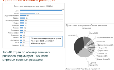
Сравнение военных расходов