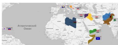
Карта крупных американских военных вмешательств после 1992 г.