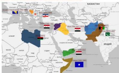
Пояс нестабильности на Ближнем Востоке